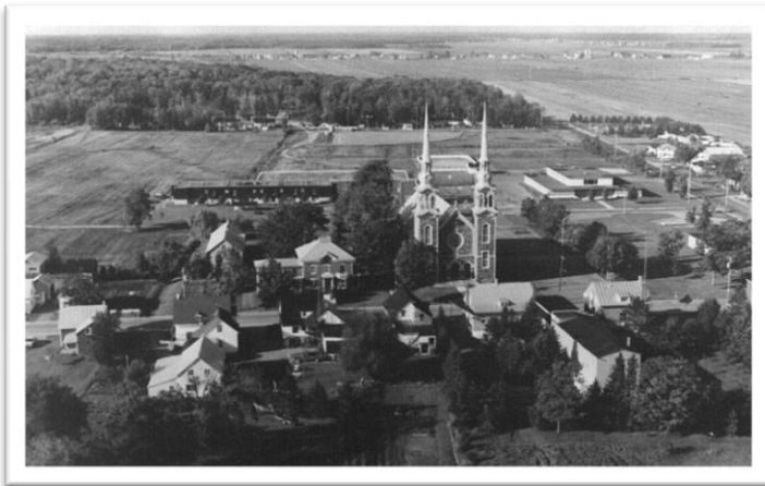
Village de Sainte-Gertrude.

De 1851 à 1881, la paroisse absorbe une partie du débordement des vieux terroirs riverains et Sainte-Gertrude connaît une hausse démographique importante. Plusieurs nouveaux ménages qui s'implantent à Sainte-Gertrude portent d'ailleurs les noms de vieilles familles établies dans les paroisses de Saint-Grégoire, Gentilly, Bécancour et Sainte-Angèle : Cormier, Désilets, Deshaies, Doucet, Laneuville, Leblanc, etc. La population de la paroisse passe ainsi de 1 105 habitants en 1851 à 2030 en 1881.