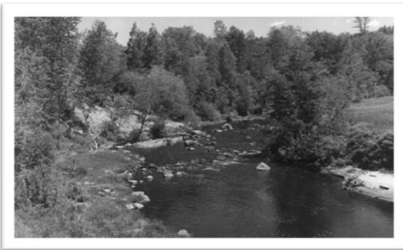
La rivière Gentilly.

Bornée à l'est et au sud par les municipalités de Sainte-Marie-de-Blandford et de Saint-Sylvère, Sainte-Gertrude partage ses limites avec Bécancour et Gentilly au nord, et Précieux-Sang à l'ouest. Sa position dans l'arrière-pays de la ville de Bécancour, hors des anciennes zones de peuplement, lui confère un visage original, tant sur le plan géographique que socio-économique. Ces traits particuliers, acquis dès les premiers moments de l'existence de la paroisse, sont toujours perceptibles dans le paysage de Sainte-Gertrude.