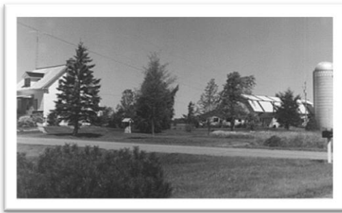
Une ferme d'aujourd'hui. Le 7075, route des Ormes.

du lot de l'agriculteur qui en tire l'essentiel des ressources permettant le fonctionnement de l'entreprise agricole. Sur le principe de l'assolement, la terre se divise en plusieurs champs sur lesquels se succèdent diverses cultures : la première année, on cultive l'avoine et la deuxième, le foin, le trèfle et la luzerne. Au cours des cinquième et sixième années, ils servent de pâturage aux vaches laitières. Finalement, la dernière partie du lot est réservée au boisé. Celle-ci permet à l'agriculteur de s'approvisionner en bois de chauffage, en bois de construction et parfois en sucre d'érable. Des fossés divisent les diverses parcelles ainsi que les lots tout en permettant le drainage du sol.