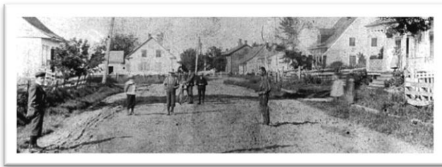
Le village de Saint-Grégoire en 1896.

la population est incluse dans la paroisse de Bécancour. Cependant en 1790, une vingtaine d'années après l'arrivée des Acadiens, la paroisse de Bécancour est plus peuplée que celle de Nicolet, soit 1027 individus contre 884. Et n'oublions pas qu'à la même époque, Trois-Rivières ne compte que 1213 habitants. Au même moment, le noyau villageois de Sainte-Marguerite compte déjà 447 personnes et six ans plus tard, la liste dressée pour la requête en vue de l'érection de la paroisse de Saint-Grégoire recense 680 personnes qui résident au village, et ce, sans compter les habitants du rang des Acadiens et du lac Saint-Paul.